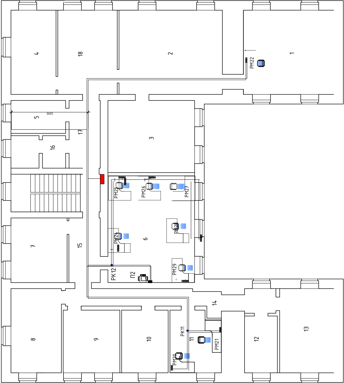
План 2-го этажа СКС